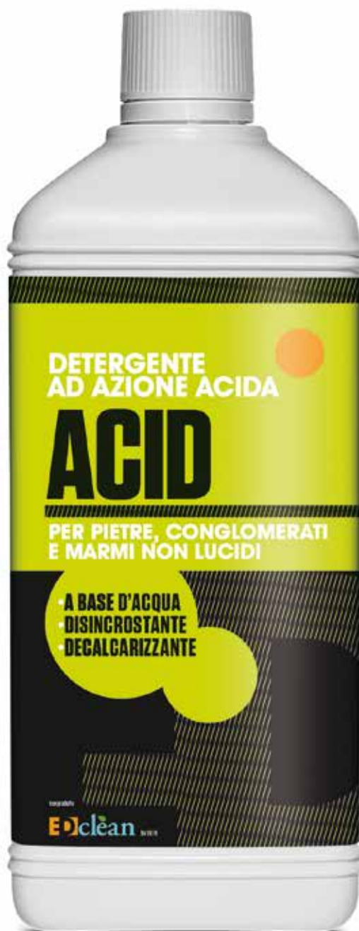
Flacone da 1 lt.