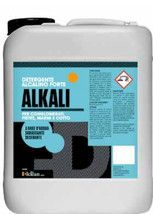
Tanica da 5 lt.