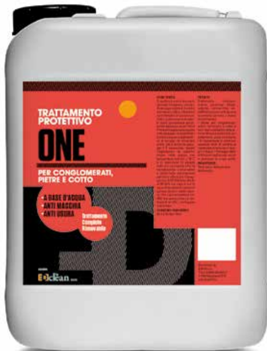
Tanica da 5 lt.