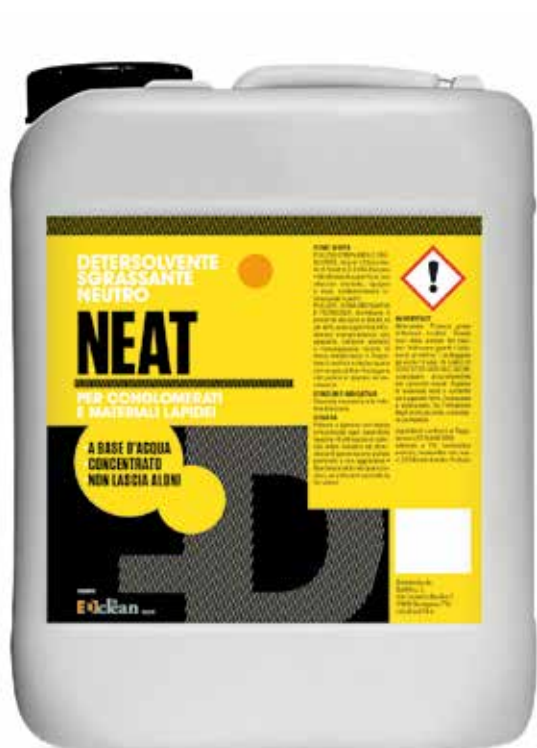
Tanica da 5 lt.

A BASE D'ACQUA CONCENTRATO NON LASCIA ALONI