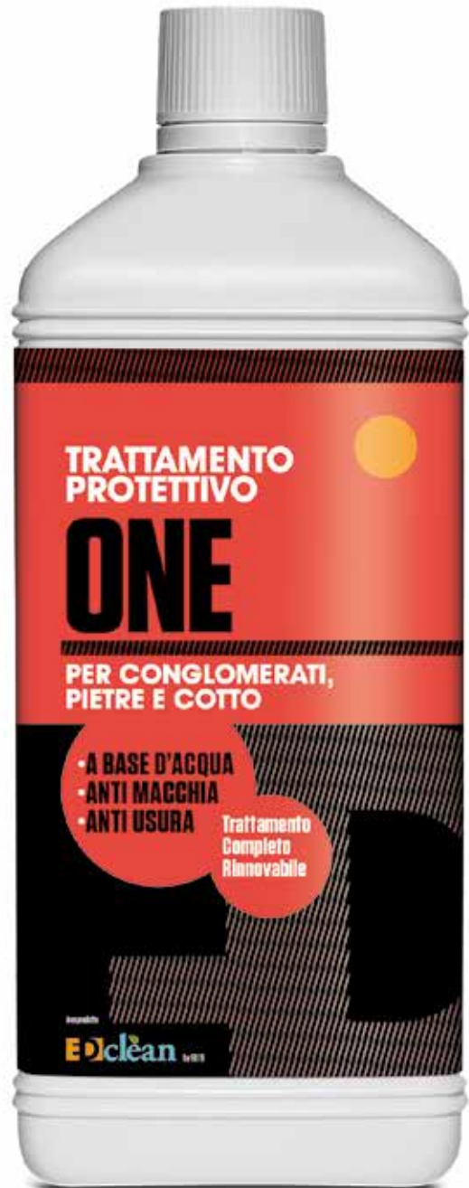
Flacone da 1 lt.