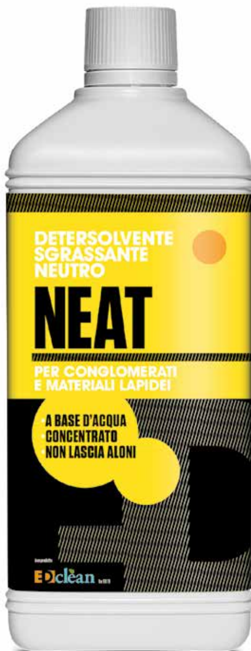
Flacone da 1 lt.