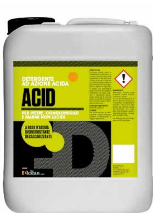
Tanica da 5 lt.

A BASE D'ACQUA DISINCROSTANTE DECALCARIZZANTE